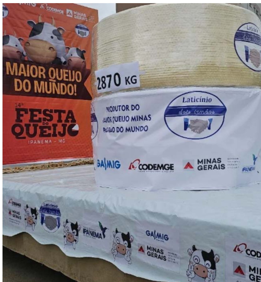
O maior queijo minas padrão do mundo com 2870 kg

A 14ª Festa do Queijo, em Ipanema-MG, encerrada 1 de junho último, promoveu as quebras de recordes de maiores queijo minas padrão e doce de leite do mundo. O queijo foi produzido pelo Laticínios Dois Irmãos (Nascimento e Silva Ind. Com. Ltda), que utilizou 28 mil litros de leite e obteve uma peça de 2.870 Kg. E o maior doce de leite, produzido pela a fábrica de doces Nhá Nair (Nhá Nair Ind. Com. de Leite Ltda), precisou de 2,5 mil litros de leite e 700 quilos de açúcar para fazer um doce de leite com 1.210 quilos. A conferência e homologação dos recordes é feita pela Rank Brasil, a Festa do Queijo é organizada pela Prefeitura em parceria com comerciantes e indústrias de laticínios da região e movimenta todo setor comercial e econômico do município. São três dias de celebração, com atrações musicais, concursos gastronômicos, barracas de artesanatos, comidas caseiras, shows locais, e muito mais. Os parabéns ao Laticínios Dois Irmãos e Nhá Nair, clientes da ABC.