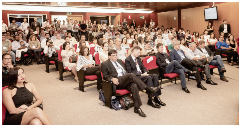
A programação foi intensa e contou com muitos participantes

A ABC Comércio e Representações Ltda foi por mais um ano parceira na realização da Assembléia Geral Ordinária do Silemg – Sindicato das Indústrias de Laticínios - MG, esta edição em 19 de outubro último, em Belo Horizonte – MG. O evento contou com prestação de contas do exercício 2016 e orçamento para 2018, palestras e debates do setor lácteo. Novos associados e fornecedores do Silemg foram apresentados, bem como panoramas econômicos do setor e de todo o Brasil foram debatidos, com perspectivas de crescimento para o próximo ano, baseados em investimentos em novos produtos para uma população ainda jovem e de alto consumo.