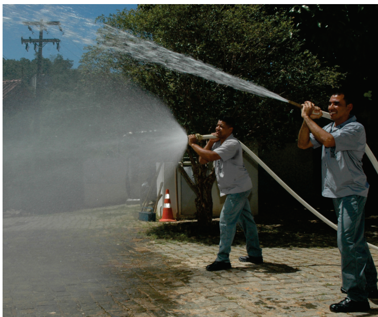
Os brigadistas tiveram aula prática sobre combate a incêndio

No conteúdo temas como: “Propagações do Fogo”; “Classes de Incêndio”; “Métodos de Extinção”; “Agentes Extintores”; “Equipamentos de Combate a Incêndio”; “Equipamentos de Detecção, Alarmes, Comunicação e Iluminação de Emergência”, entre outros.